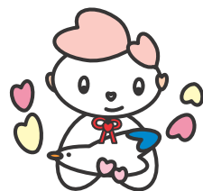
横浜市社会福祉士会 キャラクター「ハグミィ」

「やさしい日本語」は、普段使うことばを外国人にも分かるように配慮した、簡単な日本語で、日常のコミュニケーションに役立ちます。この度、港北区連絡会では、横浜市国際交流協会および港北国際交流ラウンジと協働し「やさしい日本語」の活用について楽しく学ぶ講座を企画しました。多文化共生について考えるとともに、外国の方に限らず高齢・障がいの方や子どもを含めた「ユニバーサルなことば」としての可能性や広がりについて、思いをめぐらせてみませんか。権利擁護や意思決定支援…その前提となる「情報保障」を考えることにもつながります。